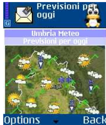
Content of the message

The destination mobile phone will receive a message SMS textual or a message of type WAP-PUSH (based on the chosen content). When the message is opened, it will be possible to see the acquired content (in the case of a WAP-PUSH, a GPRS connection will be necessary).